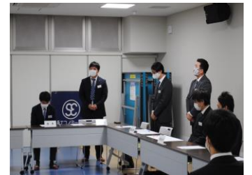
2020年新入会員 オリエンテーション