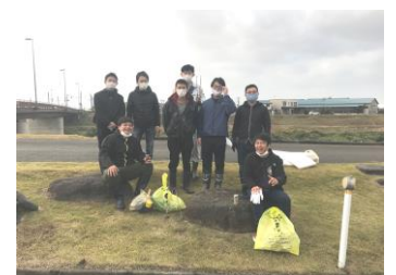
2020年 五十嵐川クリーン作戦

A. 地域性もあり、製造業に携わる会員が最も多くなっています。製造業も金属、プラスチック、木工、紙器、印刷等々、様々なものを扱い、製造する事業所が集まっています。その他に建設業、設備業、運送業、物流、自動車関連、造園、住宅関連、金融機関、IT、不動産、飲食店、その他サービス業などなど、ありとあらゆる業種から会員が三条エコノミークラブに参加しています。