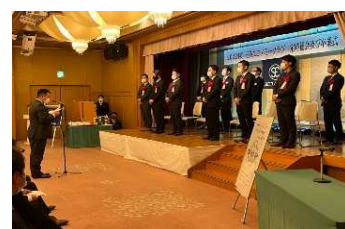
2022年12月 定時総会、卒業式