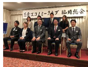
2022年7月 臨時総会 (次年度会長の承認)

🏠 会費は入会初年度に納める入会金 5,000 円と年会費 48,000 円です。年会費については年初に一括で納めます。(途中入会の場合は月割) この会費の使われ方は、会運営のために多岐に渡って使われており、主に例会で講演頂く講師への謝礼やグループ活動、委員会活動を行うための活動費、対外交流事業を行うための活動費、今後の事業のための積み立て等、有効に使われております。なお、講演会等の本例会参加費は無料です。グループ例会、総会等は別途参加費が必要な場合があります。