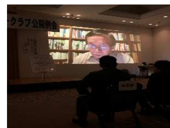
2022年 公開例会 (オンライン配信)