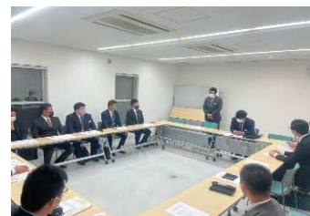
2022年 新入会員 オリエンテーション