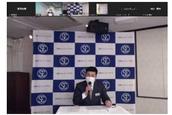
2022年1月 臨時総会 (オンライン)

🏠 地域性もあり、製造業に携わる会員が最も多くなっています。製造業も金属、プラスチック、木工、紙器、印刷等々、様々なものを扱い、製造する事業所が集まっています。その他に建設業、設備業、運送業、物流、自動車関連、造園、住宅関連、金融機関、IT、不動産、飲食店、その他サービス業などなど、ありとあらゆる業種から会員が三条エコノミークラブに参加しています。