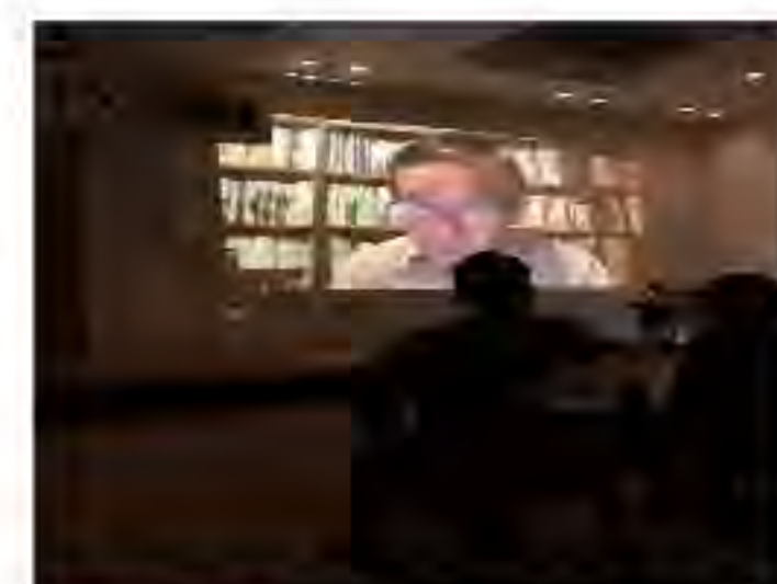
2022年 公開例会 (オンライン配信)