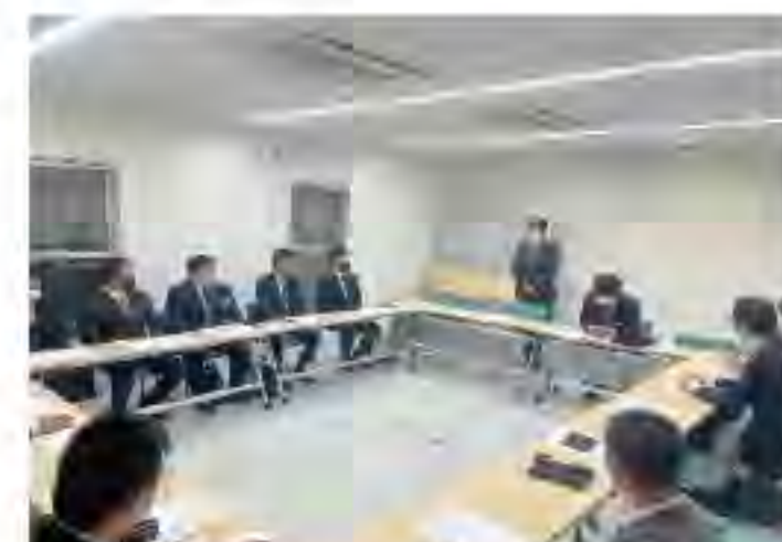
2022年 新入会員 オリエンテーション