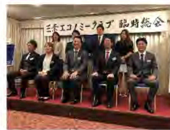
2022年7月 臨時総会 (次年度会長の承認)

A 会費は入会初年度に納める入会金 5,000 円と年会費 48,000 円です。年会費については年初に一括で納めます。(途中入会の場合は月割) この会費の使われ方は、会運営のために多岐に渡って使われており、主に例会で講演頂く講師への謝礼やグループ活動、委員会活動を行うための活動費、対外交渉事業を行うための活動費、今後の事業のための積み立て等、有効に使われております。なお、講演会等の本例会参加費は無料です。グループ例会、総会等は別途参加費が必要な場合があります。