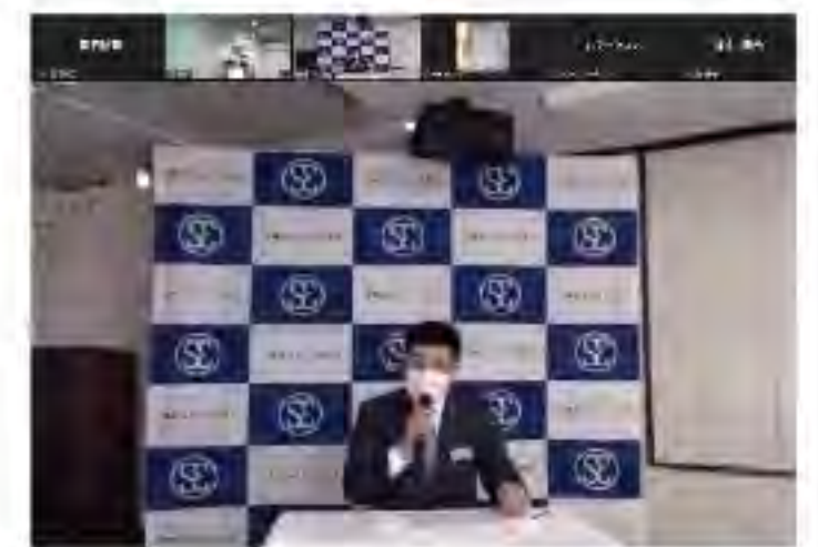
2022年1月 臨時総会 (オンライン)

👉 地域性もあり、製造業に携わる会員が最も多くなっています。製造業も金属、プラスチック、木工、紙器、印刷等々、様々なものを扱い、製造する事業所が集まっています。その他に建設業、設備業、運送業、物流、自動車関連、造園、住宅関連、金融機関、IT、不動産、飲食店、その他サービス業などなど、ありとあらゆる業種から会員が三条エコノミークラブに参加しています。