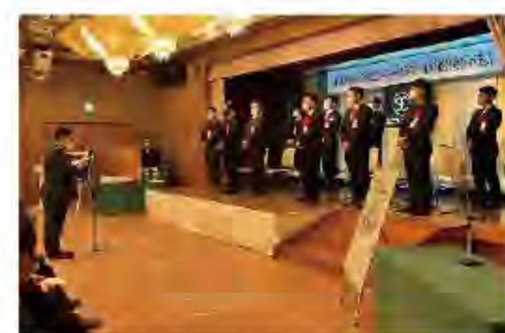
2022年12月 定時総会、卒業式