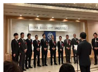
2023年 12月 定時総会、卒業式