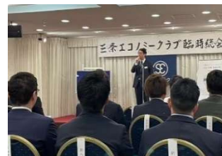
2023年 7月 臨時総会