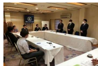
2023年 新入会員 オリエンテーション

🏠 会費は入会初年度に納める入会金 5,000 円と年会費 48,000 円です。年会費については年初に一括で納めます。(途中入会の場合は月割) この会費の使われ方は、会運営のために多岐に渡って使われており、主に例会で講演頂く講師への謝礼やグループ活動、委員会活動を行うための活動費、対外交渉事業を行うための活動費、今後の事業のための積み立て等、有効に使われております。なお、講演会等の本例会参加費は無料です。グループ例会、総会等は別途参加費が必要な場合があります。