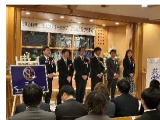
2024 年 12 月 定時総会、卒業式