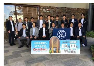
2024 年 10 月 研修旅行