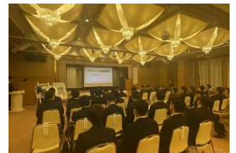
2024年3月 OB 公開例会