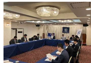
2024 年 新入会員 オリエンテーション