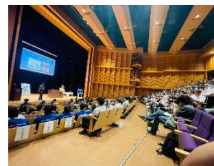
2024 年 9 月 公開例会