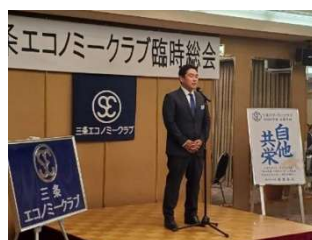
2024 年 7 月 臨時総会